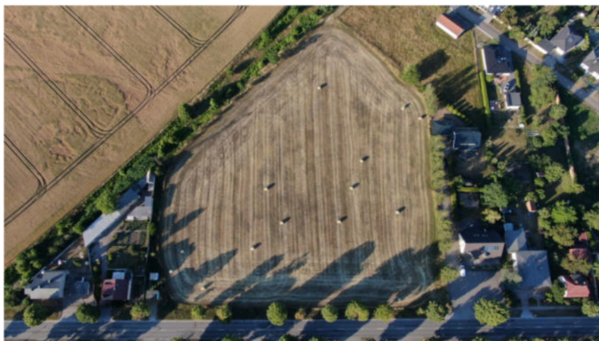
Darstellung: Draufsicht des Plangebietes, ohne Bewuchs und Darstellung der Nachbarbebauung, Quelle: private Aufnahme des Eigentümers

Der gesamte Geltungsbereich ist frei von Bewuchs.