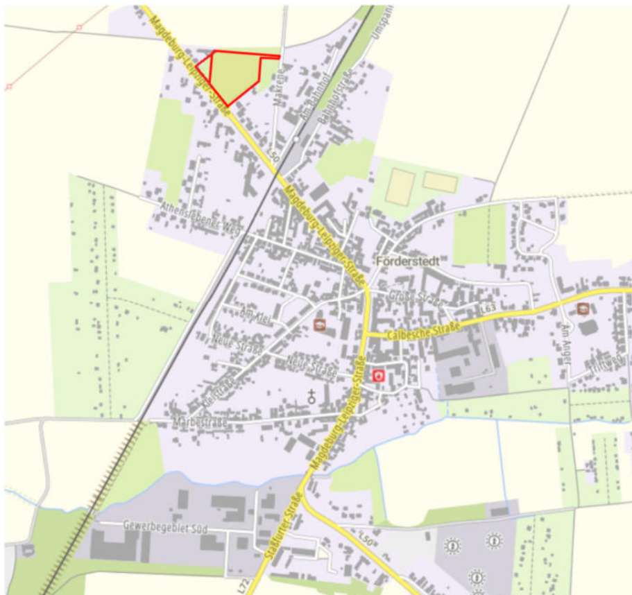
Abb. Ohne Maßstab (BKG 2023, GeoBasis-DE/LVermGeo LSA 2023)

Der Bereich umfasst die Flurstücke 1077/71 und 69/3 der Flur 6, Gemarkung Förderstedt.